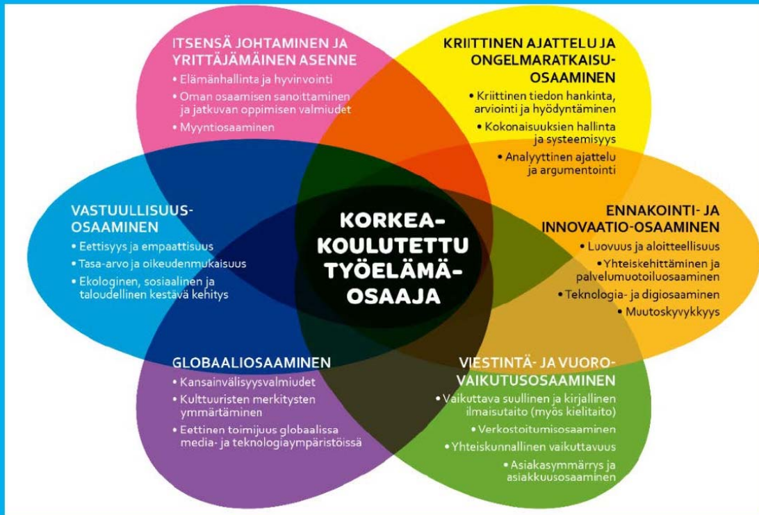
Kuva 1. Yleiset, kaikille tutkinnoille yhteiset työelämävalmiudet.