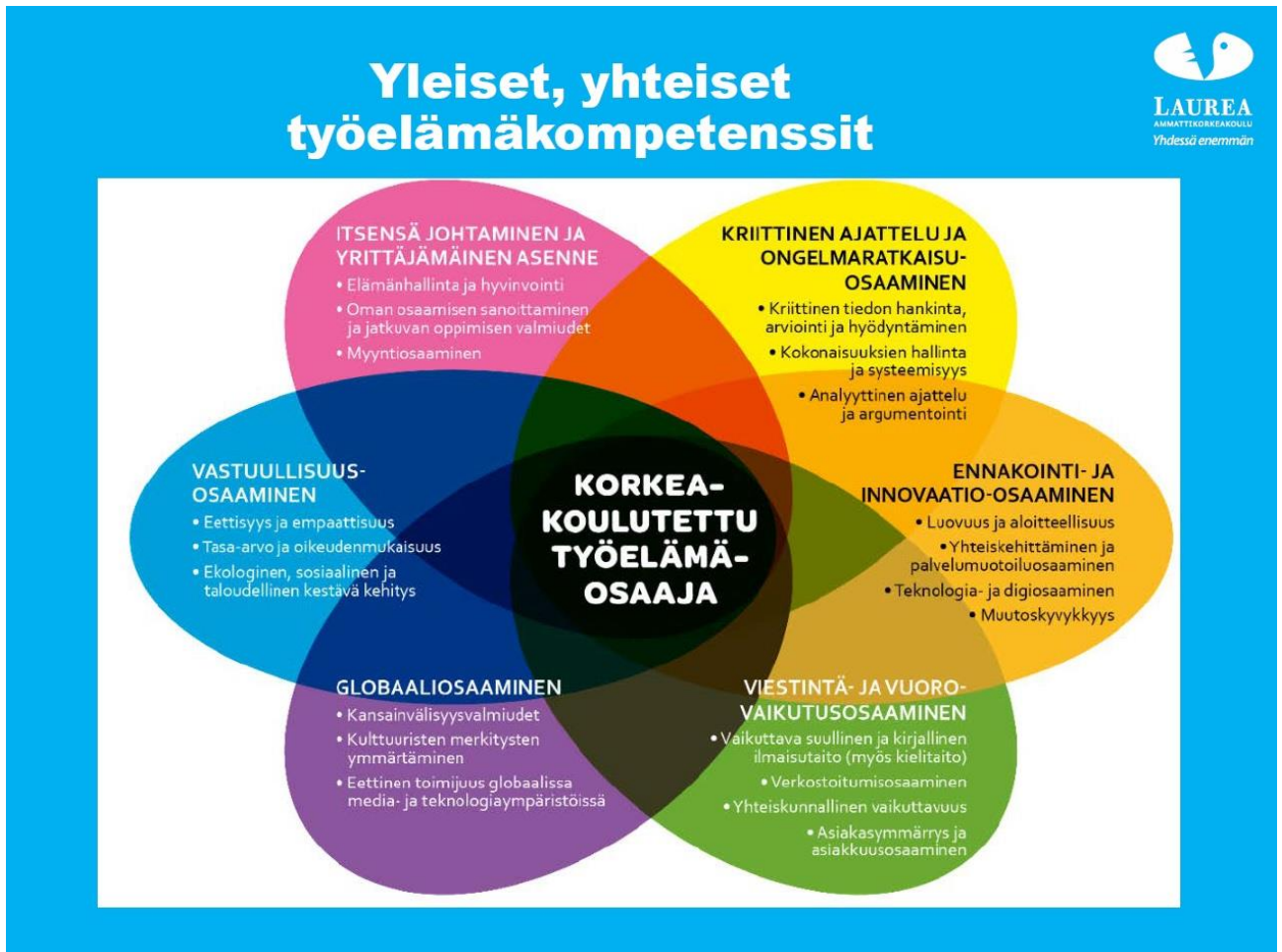
Kuva 1. Yleiset, kaikille tutkinnoille yhteiset työelämävalmiudet.

Koulutus tähtää laaja-alaiseen ja vahvaan ammatilliseen osaamiseen. Työelämälähtöisissä hankkeissa kehität myös yleisiä työelämävalmiuksiasi (ks. kuva 1). Tutkinnon suorittaneella on valmiudet seurata ja edistää oman ammattialansa kehittymistä sekä edellytykset oman ammattitaidon jatkuvaan kehittämiseen. Koulutus antaa riittävän viestintä- ja kielitaidon oman alan tehtäviin sekä kansainväliseen toimintaan ja yhteistyöhön.