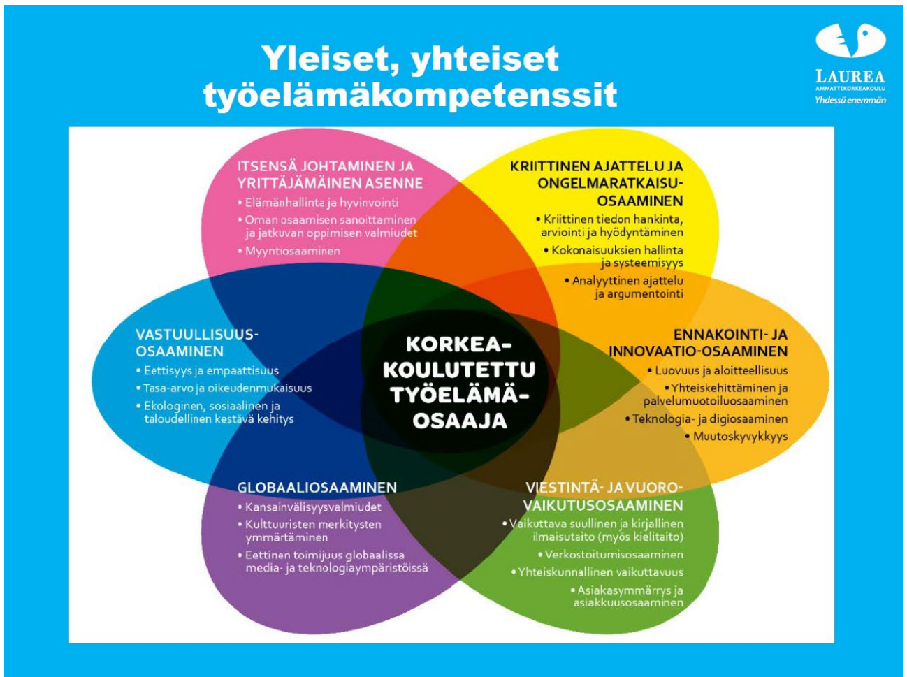
Kuva 1. Yleiset, kaikille tutkinnoille yhteiset työelämävalmiudet.

ja edistää oman ammattialansa kehittymistä sekä edellytykset oman ammattitaidon jatkuvaan kehittämiseen. Koulutus antaa riittävän viestintä- ja kielitaidon oman alan tehtäviin sekä kansainväliseen toimintaan ja yhteistyöhön.