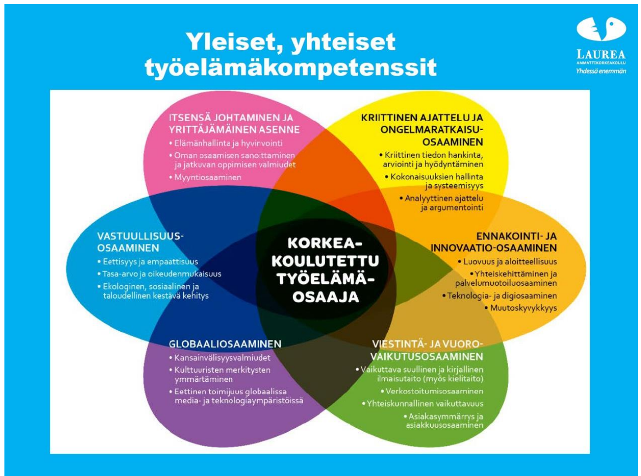
Kuva 1. Yleiset, kaikille tutkinnoille yhteiset työelämävalmiudet.

Koulutus tähtää laaja-alaiseen ja vahvaan ammatilliseen osaamiseen. Työelämälähtöisissä hankkeissa kehität myös yleisiä työelämävalmiuksiasi (ks. kuva 1). Tutkinnon suorittaneella on valmiudet seurata ja edistää oman ammattialansa kehittymistä sekä edellytykset oman ammattitaidon jatkuvaan kehittämiseen. Koulutus antaa riittävän viestintä- ja kielitaidon oman alan tehtäviin sekä kansainväliseen toimintaan ja yhteistyöhön.