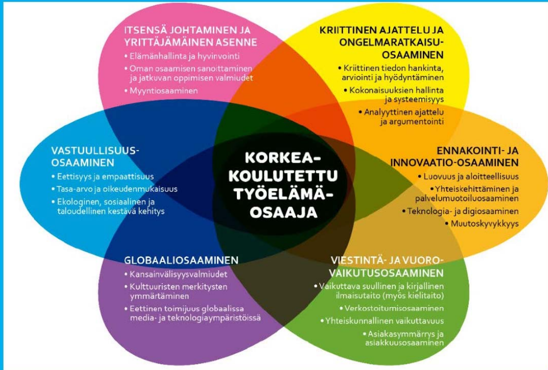
Kuva 1. Yleiset, kaikille tutkinnoille yhteiset työelämävalmiudet.